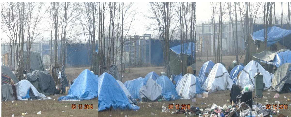
ГП Келебија - децембар 2016. год.