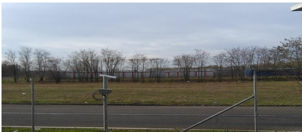
ГП Келебија - новембар 2017. год.

Тим НПМ је обавио разговоре са мигрантима затеченим на граничним прелазима и утврдио да они на недељном нивоу добијају списак од 25 – 30 миграната који се налазе у центрима у Србији и који желе пријем у Мађарску. Они ове спискове предају мађарским властима, који на лицу места или у кратком временском периоду направе распоред пријема. Тако утврђену листу ови мигранти предају службеницима Комесаријата. Пријем је радним данима у 8:00 часова. Мигранти чији је термин дођу или их доведу дан раније и овде преспавају, а неки директно из прихватног центра дођу на пријем. Представници миграната обично чекају 25 – 30 дана пре него што и њих приме, па онда долазе нови. На ГП Келебија мигранти спавају у напуштеном чврстом објекту, а на ГП Хоргош у шаторима (у једном представници миграната, у једном они који би требало да уђу у Мађарски и у једном они који су враћени у Србију). Овде имају на располагању мобилне тоалете, који се чисте једном недељно, туширају се у Прихватном центру у Суботици, храну, воду и одећу им доносе хуманитарне организације и 1 недељно их обилазе лекари. 13 Поред службеника Комесаријата, обилазе их и полицијски службеници и међународне организације.