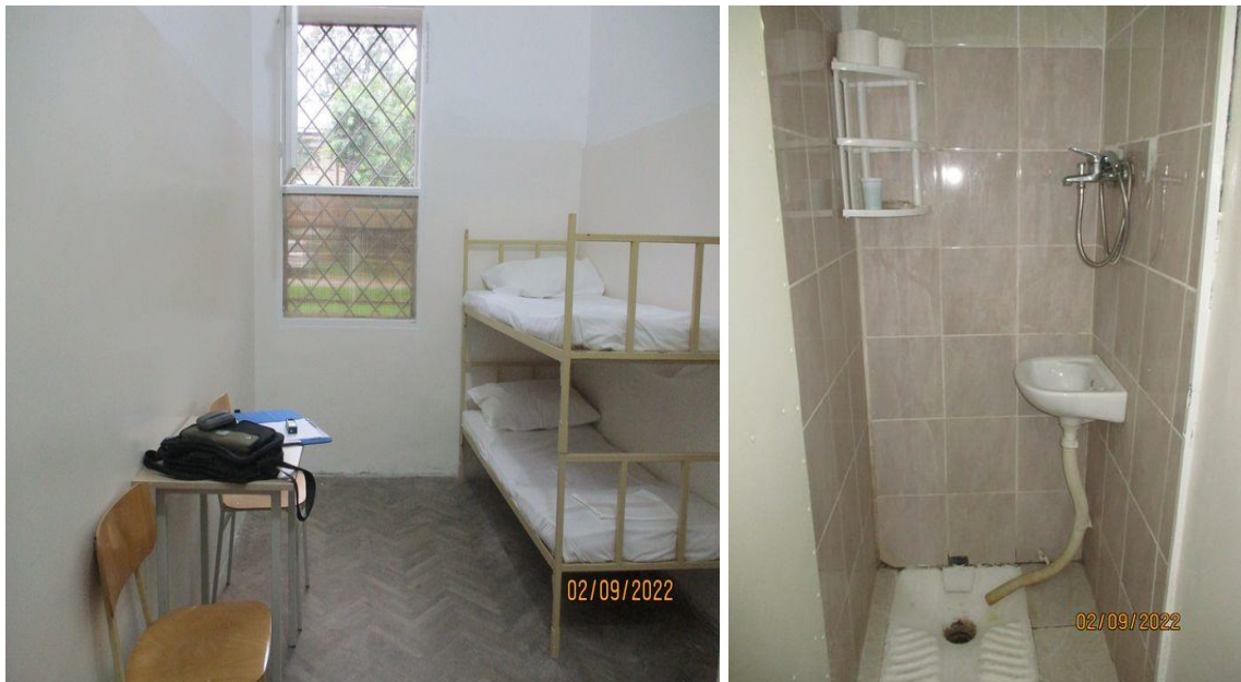
Просторија за задржавање у КПЗ Пожаревац

НПМ похваљује све активности које су предузете у циљу унапређења услова у просторији за задржавање у КПЗ Пожаревац.