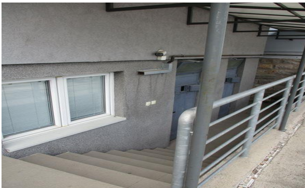
прилаз просторијама за задржавање седиште ПУ Чачак

У седишту ПУ Чачак постоје две просторије за задржавање, које су намењене за по једно лице, које изгледају идентично и услови у њима су исти. Димензије просторија су по око 8 m 2 , рачунајући и мокри чвор површине око 1 m 2 . Просторије се налазе једна поред друге и то са задње стране зграде. Њима се приступа са задњег паркинга. Полицијски службеници наводе да им ова раздаљина, а нарочито низ степеника, представљају проблем када спроводе лица која су често под утицајем алкохола или психоактивних супстанци. Изнад врата и са бочних страна зидова су постављене камере које покривају овај простор и прилаз просторијама за задржавање.