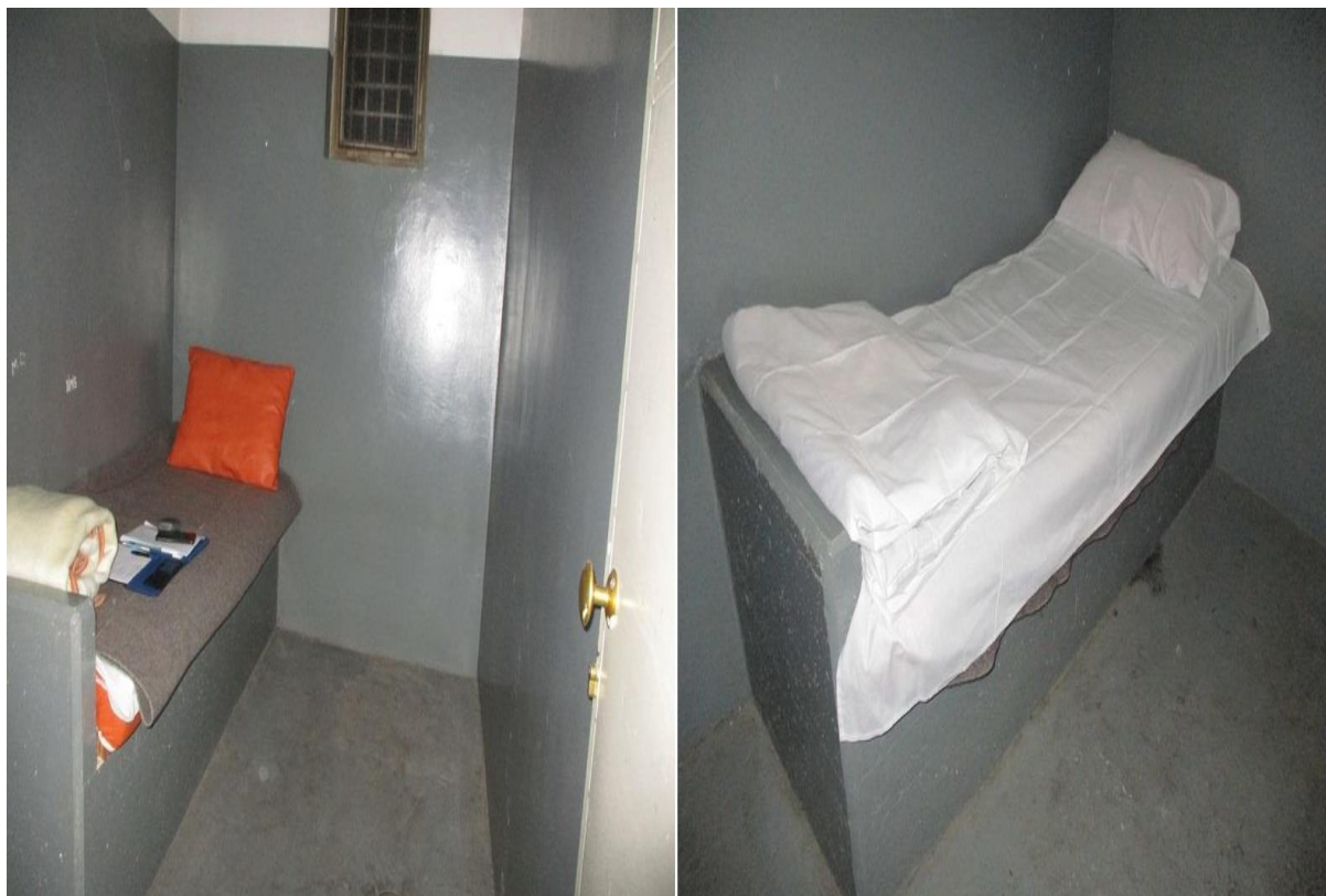
просторије за задржавање ПС Ивањица

Просторије су покривене системом видео надзора, о чему постоји обавештење унутар просторија, испод камера. Такође, инсталиран је и систем за позивање и комуникацију са дежурним полицијским службеницима, који је у функцији. НПМ констатује да је у овом погледу унапређено стање у просторијама за задржавање у односу на претходну посету овој полицијској станици , након које је у Извештају о посети препоручено да се просторије покрију видео надзором и да се инсталира дугме за позивање дежурног полицијског службеника. 33