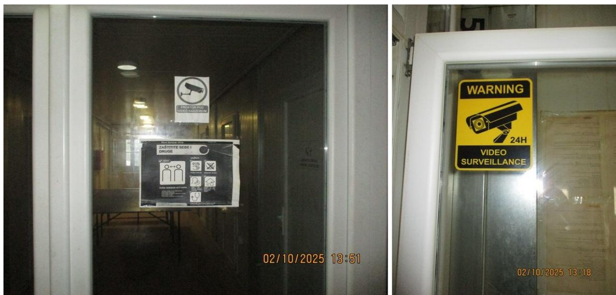
обавештења о видео надзору