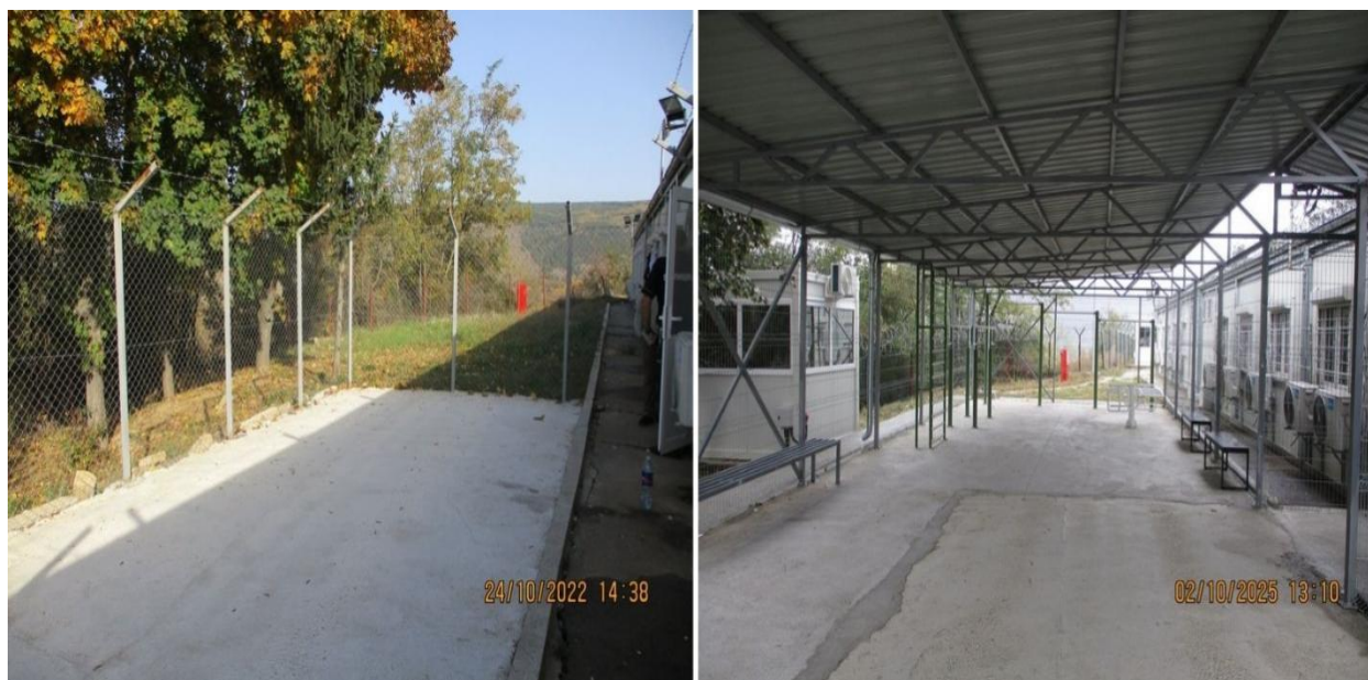
простор за боравак на отвореном – фотографије из претходне и ове посете

Простор за боравак на отвореном сада је покривен надстрешницом и опремљен справама за телесне вежбе и клупама. Овај простор странци користе свакодневно, по 1 – 2 сата.